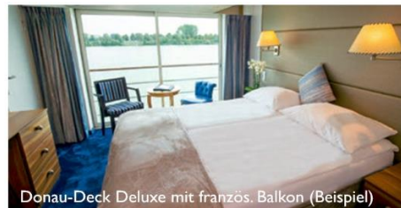
Donau-Deck Deluxe mit franz. Balkon (Beispiel)