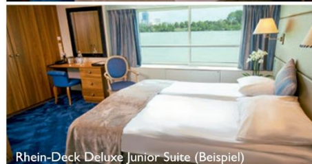
Rhein-Deck Deluxe Junior Suite (Beispiel)