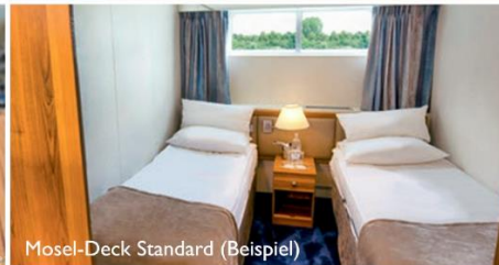
Mosel-Deck Standard (Beispiel)