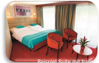
Beispiel Suite mit französischem Balkon

Kabinen: Alle 72 Kabinen sind außenliegend, großzügig dimensioniert und mit zwei Betten (auf Wunsch auch separat), Dusche, WC, Waschbecken, individuell regulierbarer Klimaanlage, Schrank, Telefon, Schreibtisch, Stuhl (Amadeus-Suite zusätzlich mit Tisch und Minibar) sowie TV mit versch. Programmen (Bordkamera, Schiffsinformation, TV-Programme) ausgestattet. Auf allen Decks ist die Ausstattung der Kabinen identisch. Folgende Kabinen stehen zur Wahl: 20 Standardkabinen am Haydn-Deck (15 m 2 / nicht zu öffnende Aussichtsfenster), 5 Standardkabinen am Strauss-Deck vorne (15 m 2 / runde, zur Hälfte kippbare Fenster), 2 Junior Suiten am Strauss Deck (18 m 2 / runde, zur Hälfte kippbare Fenster), 24 Premiumkabinen am Strauss-Deck und 17 Premium-Kabinen am Mozart-Deck (alle 15 m 2 , französischer Balkon mit Glasschiebetür) sowie 4 Amadeus Suiten am Mozart- Deck (22 m 2 , französischer Balkon mit Glasschiebetür).