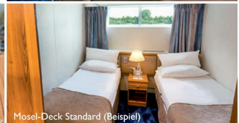
Mosel-Deck Standard (Beispiel)