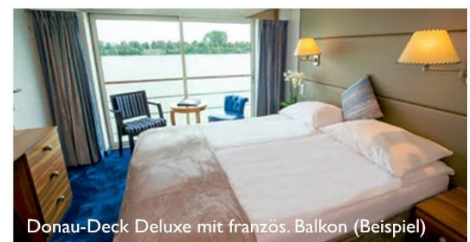
Donau-Deck Deluxe mit franz. Balkon (Beispiel)