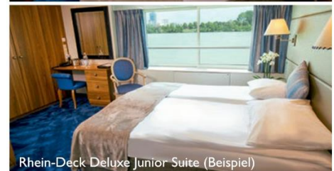
Rhein-Deck Deluxe Junior Suite (Beispiel)