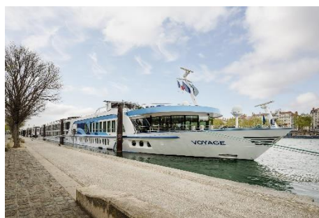
Abb. 1: MS Voyage

A ...Ausflugspaket B ...nur an Bord buchbar