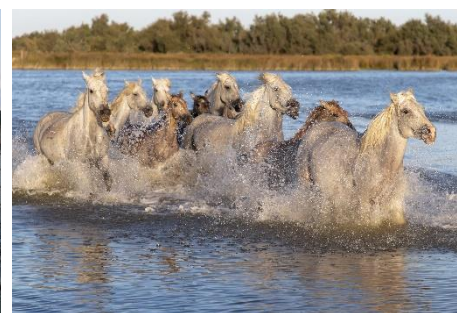
Abb. 3: Camargue