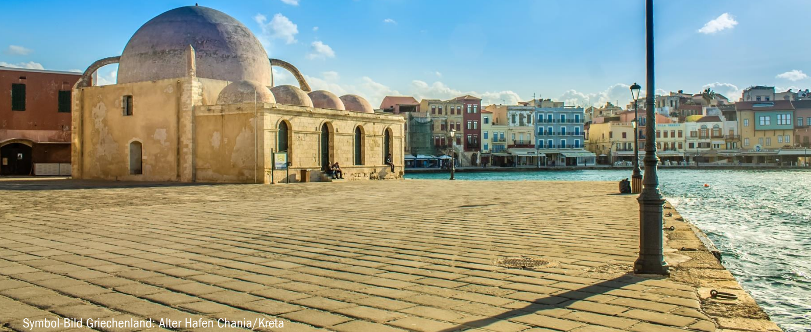
Symbol-Bild Griechenland: Alter Hafen Chania/Kreta