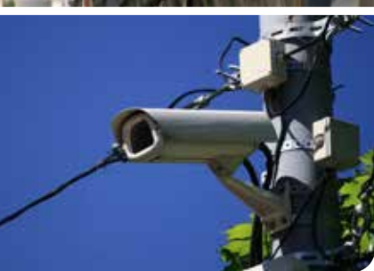
Wer unberechtigt in die Zone einfährt, wird in vielen Städten von Kameras erfasst.