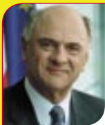
Dr. Erwin Pröll Landeshauptmann Niederösterreich

Kreuzungen zwischen Straßen und Eisenbahnen sind besonders neuralgische Punkte auf Niederösterreichs Straßen. Das Land NÖ investiert daher jährlich beträchtliche finanzielle Mittel für bauliche Maßnahmen (Unterführungen und Sicherungsanlagen) an diesen Eisenbahnkreuzungen. Ein weiterer zentraler Punkt zur Unfallverhütung an Eisenbahnkreuzungen ist die Information und Bewusstseinsbildung der Fahrzeuglenker.